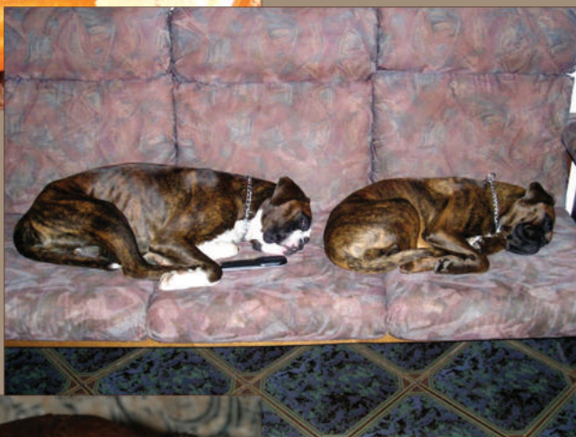
4. místo Pavla Hýbnerová